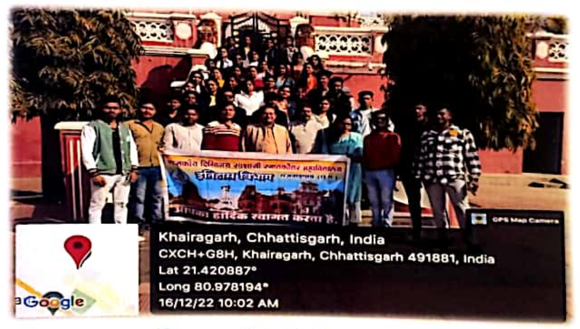
इंदिरा कला संगीत विश्वविद्यालय खैरागढ़